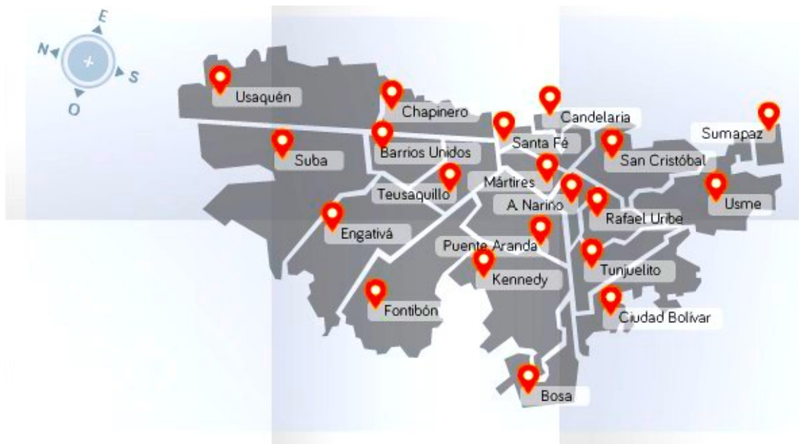
Localidades Bogotá. - Fuente: Observatorio Ambiental de Bogotá.

Los mecanismos de participación democrática enunciados representan la oportunidad para las personas de interactuar en la vida política, social y comunitaria de su territorio, de ser parte en la solución de los problemas y gestores del cambio. Es así como se constituyen en los elementos para el pleno ejercicio de la ciudadanía, con el poder para generar las transformaciones que requiere la sociedad, que trasciendan en la forma como se reconocen las personas parte del Estado y por tanto corresponsables de su progreso y de la consolidación de sus instituciones.